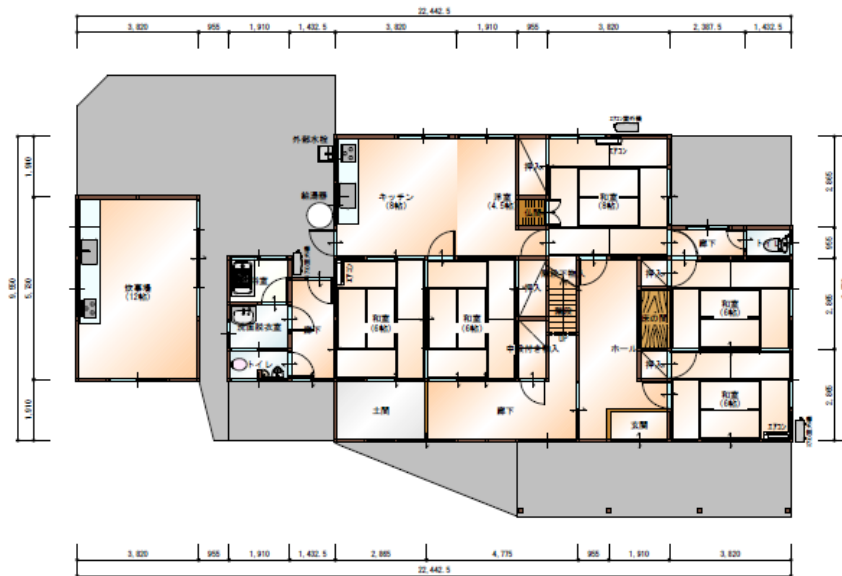
1階 平面図 S:1/150